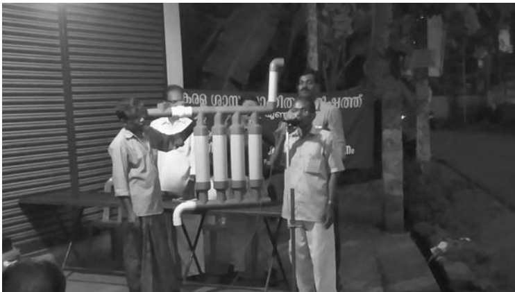
പാറമ്മൽ: കേരള ശാസ്ത്രസാഹിത്യ പരിഷ്കരണ വാഴയൂർ യൂണിറ്റിന്റെ ആഭിമുഖ്യത്തിൽ പാറമ്മൽ