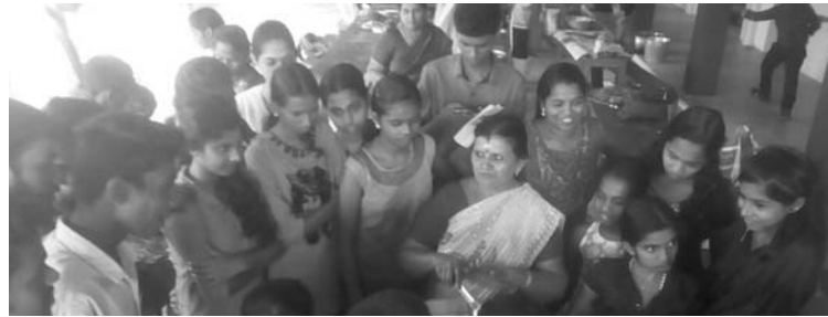
എരിവും പുളിയും പരിപാടിയിൽ കുട്ടികൾ ചേർന്ന് ഭക്ഷണം പാകം ചെയ്യുന്നു.

മുളന്തുരുത്തി ഗ്രാമപഞ്ചായത്ത് പത്താം വാർഡിനെ ഊർജഗ്രാമമാക്കി തീർക്കാൻ യുവസമിതി വാർഷിക യോഗം തീരുമാനിച്ചു. തദ്ദേശസ്വയംഭരണ സ്ഥാപനങ്ങൾ, സാങ്കേതിക വിദ്യാഭ്യാസ സ്ഥാപനങ്ങൾ എന്നിവയുടെ സഹകരണത്തോടെ വിവിധ പ്രവർത്തന പരിപാടികൾ സംഘടിപ്പിക്കും. ഊർജ സർവ്വേ, എൽ.ഇ.ഡി.ബൾബ് നിർമ്മാണപരിശീലനം, മുഴുവൻ വീടുകളിലും എൽ.ഇ.ഡി ബൾബുകൾ, ചൂടാറപ്പെട്ടി, ബയോഗ്യാസ് പ്ലാന്റുകൾ, പരിഷത്ത് അടുപ്പ് എന്നിവയുടെ വിപുലമായ പ്രചാരണം, ബോധവൽക്കരണ ക്ലാസ്സുകൾ, സെമിനാറുകൾ എന്നിവ സംഘടിപ്പിക്കും. കേരള ശാസ്ത്രസാഹിത്യ പരിഷത്ത് തുരുത്തിക്കര യൂണിറ്റിലെ